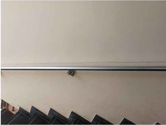
Verschmutzung des Treppenhauses