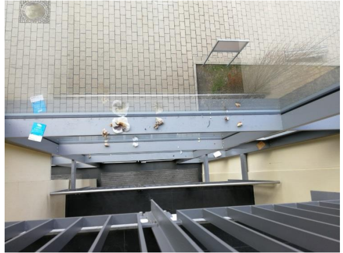
Stiftschmierereien am Handlauf über zwei Stockwerke

Bei Fragen oder Anregungen erreichen Sie den Vorstand des Schulelternbeirats der HUS wie immer über unsere e-Mail Adresse vorstand@seb-hus.de . Die Eltern-Informationen finden Sie als PDF zum Download auch auf der Website der HUS.